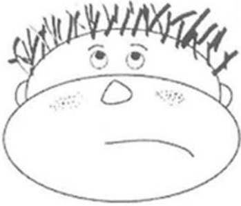
Gráfico de Caras/Sin Completar